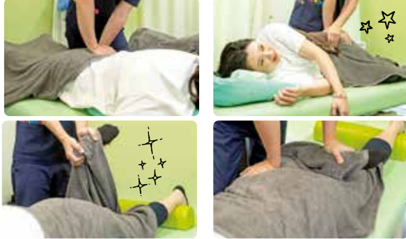
左右の歪みを整える矯正を行っていただきました。

9才、7才、3才の子どもを持つ3児のママ。ラグビーとチアを頑張る子どもたちを応援するパワフルママ。