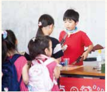
▲イベントには息子さんも積極的に参加。パパと二人三脚でお客さんの相手をしています。