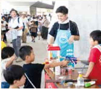
▲イベントではその日にお手伝いできるパパたちも協力しています。