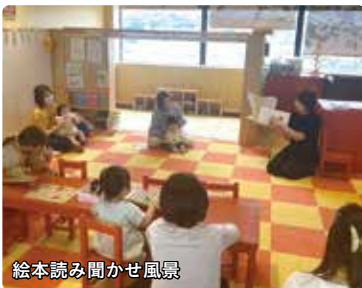
絵本読み聞かせ風景