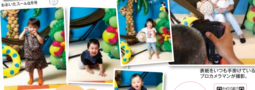
表紙をいつも手掛けているプロカメラマンが撮影。