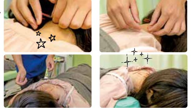
鍼による施術を初めて体験!