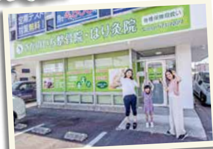
ホリママ(左)、つばさちゃん、つーちゃんママ(右)が行ってきました!